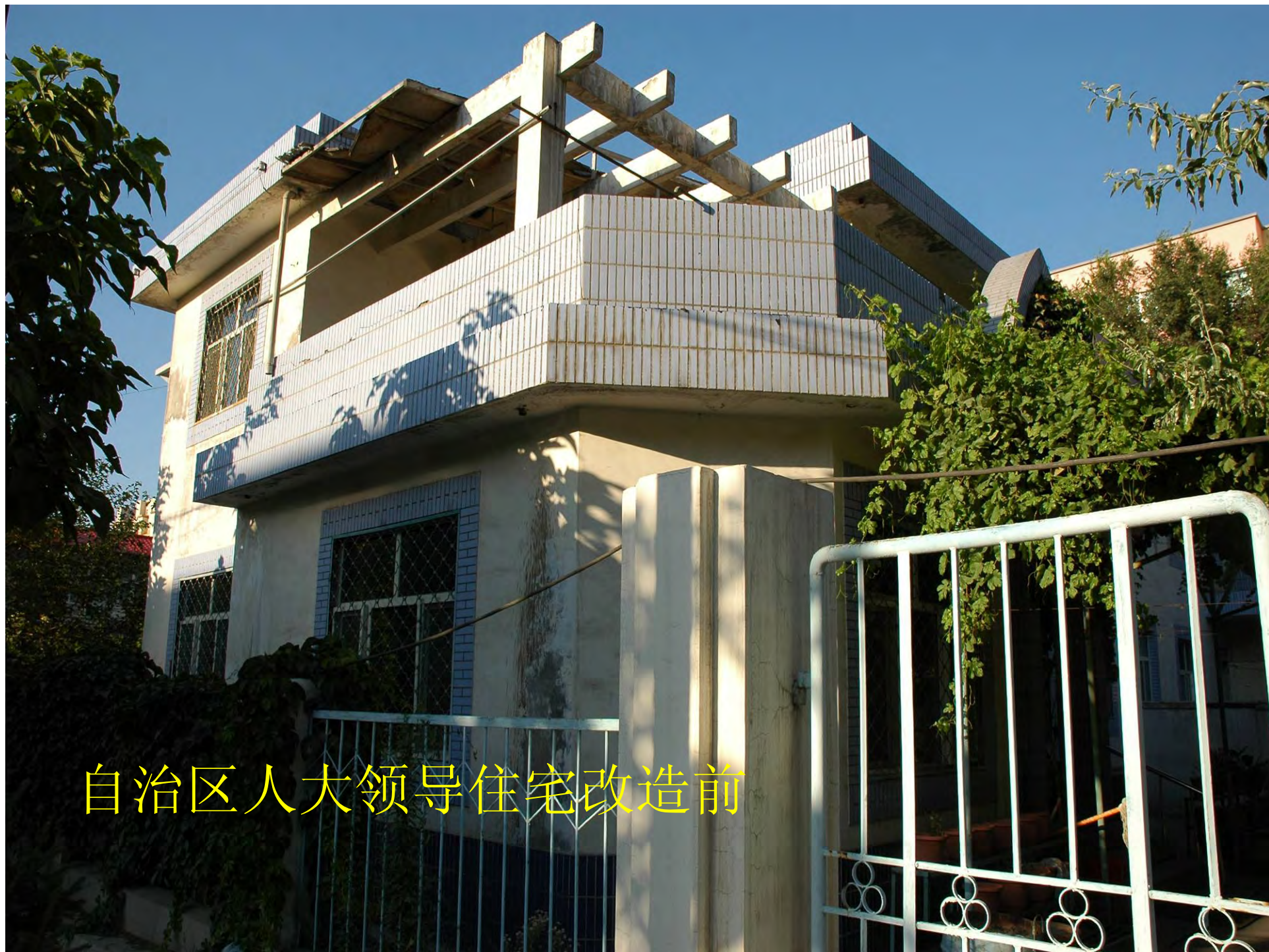
自治区人大领导住宅改造前