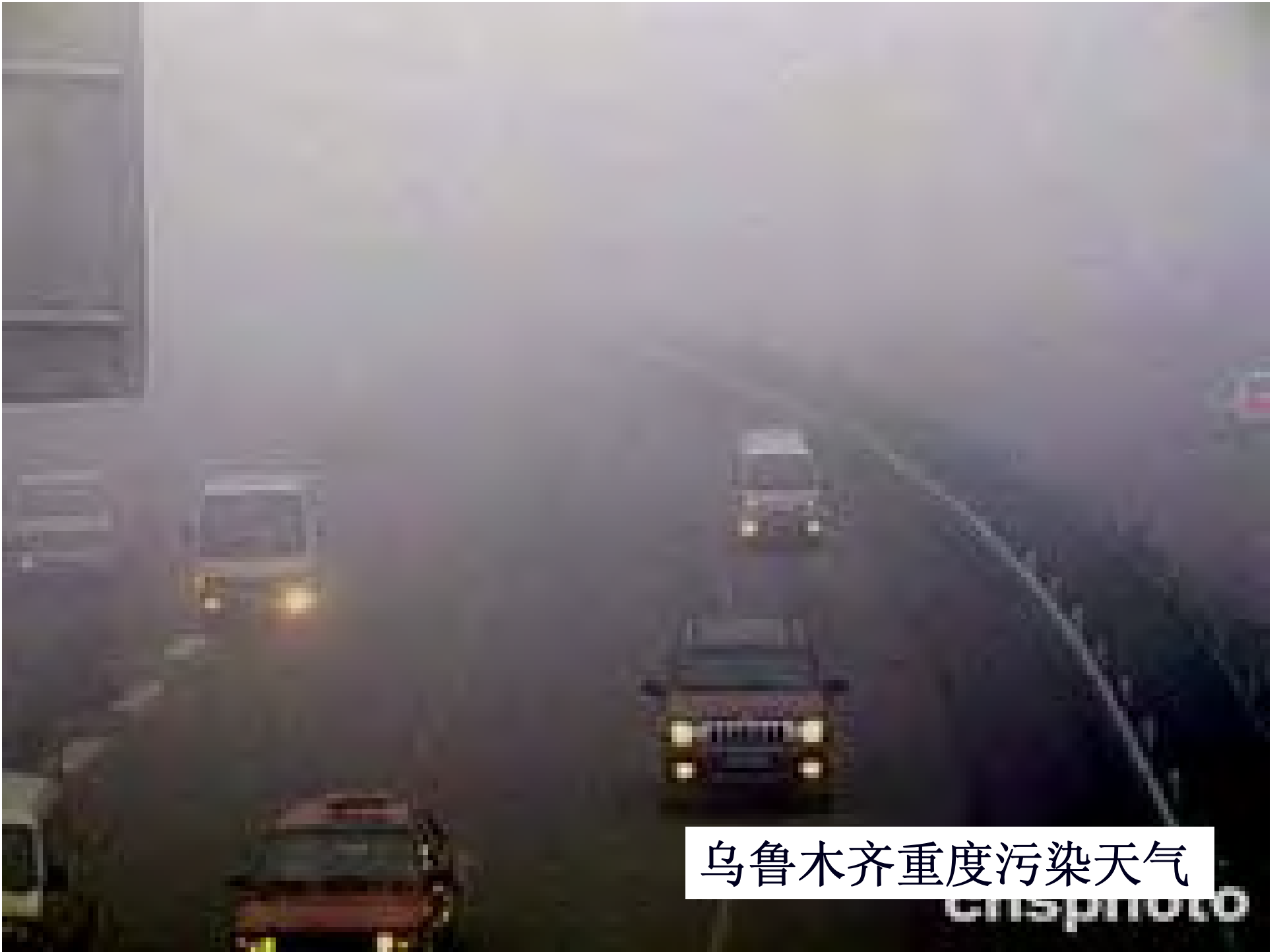
乌鲁木齐重度污染天气