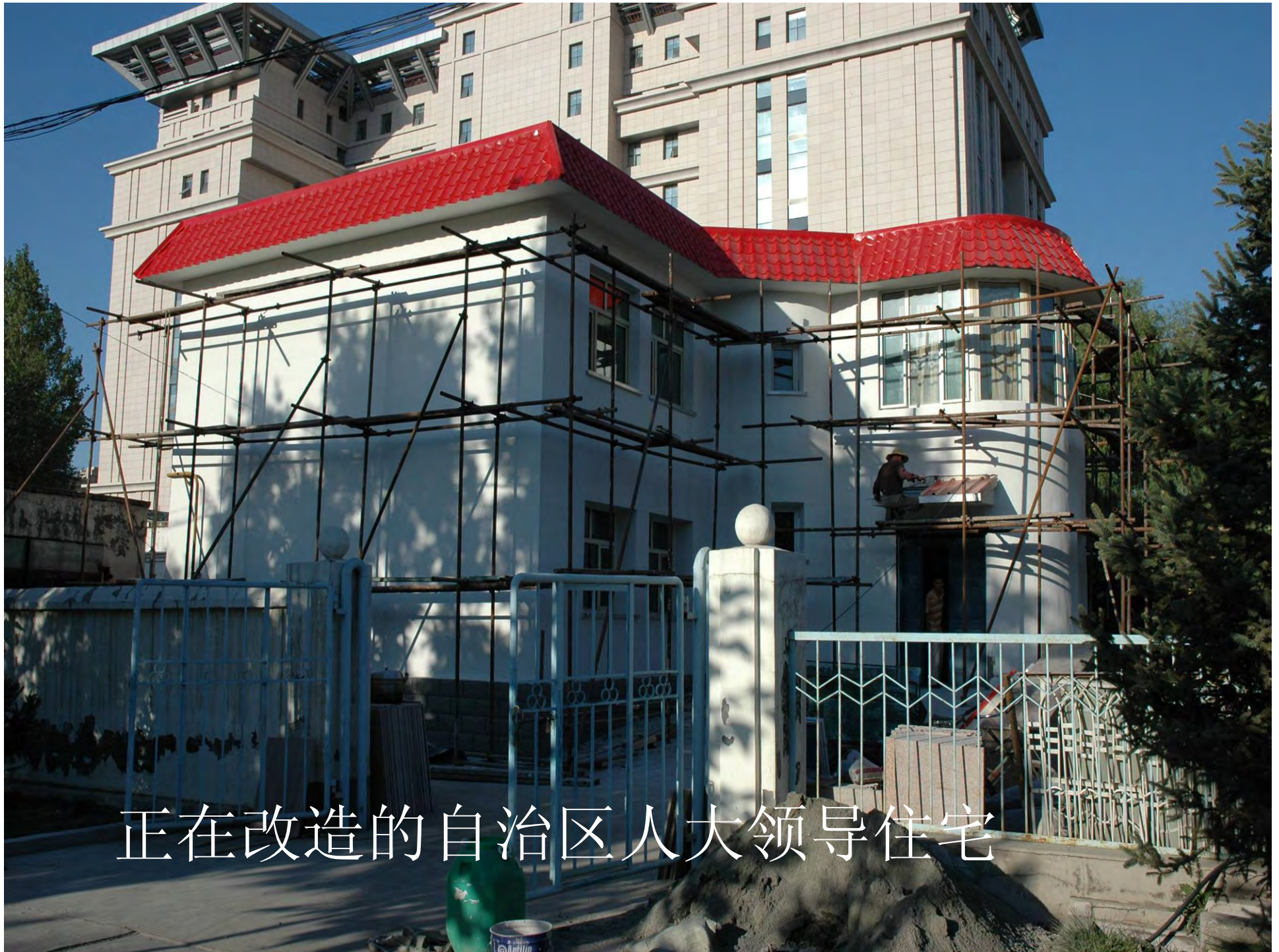
正在改造的自治区人大领导住宅