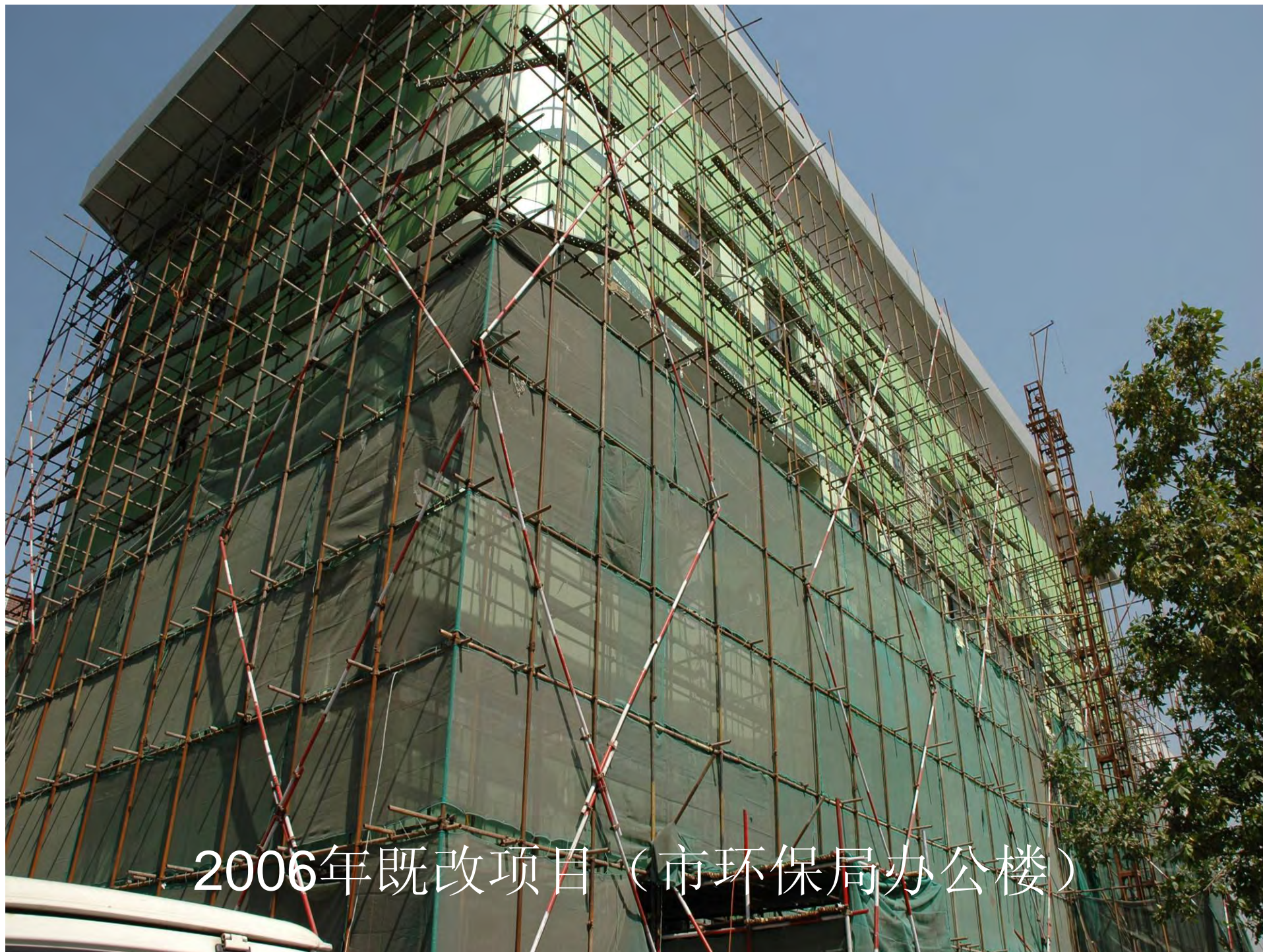
2006年既改项目（市环保局办公楼）