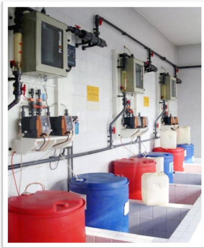
Trinkwasserdesinfektion in einem Wasserwerk in Beijing 在一所北京自来水厂进行的饮用水消毒

Experts in Chem-Feed and Water Treatment