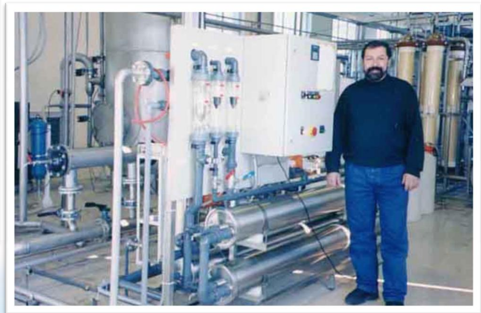
Grundwasser-Aufbereitung in einer ländlichen Gegend Chinas 中国农村地区地下水处理